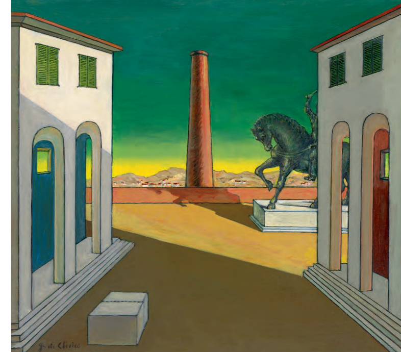
Giorgio de Chirico: Piazza d'Italia con cavallo, um 1970, © VG Bild-Kunst, Bonn 2016

... de Chirico, Giacometti, Lassnig, Picasso ... Meisterwerke aus der Sammlung Klewan 9. Juli – 13. November 2016